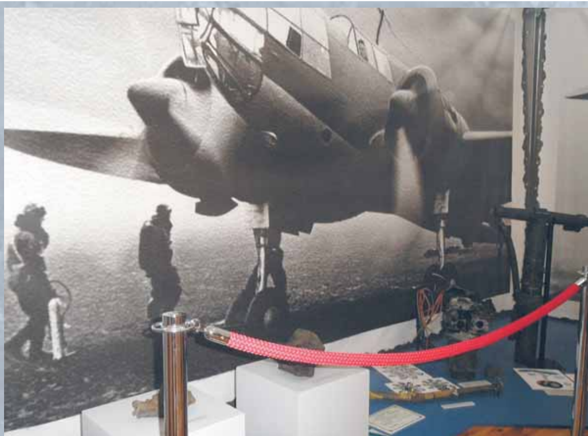
Części „Łosia” eksponowane w MWP w Warszawie na wystawie w dniu Święta Niepodległości w 2011 roku