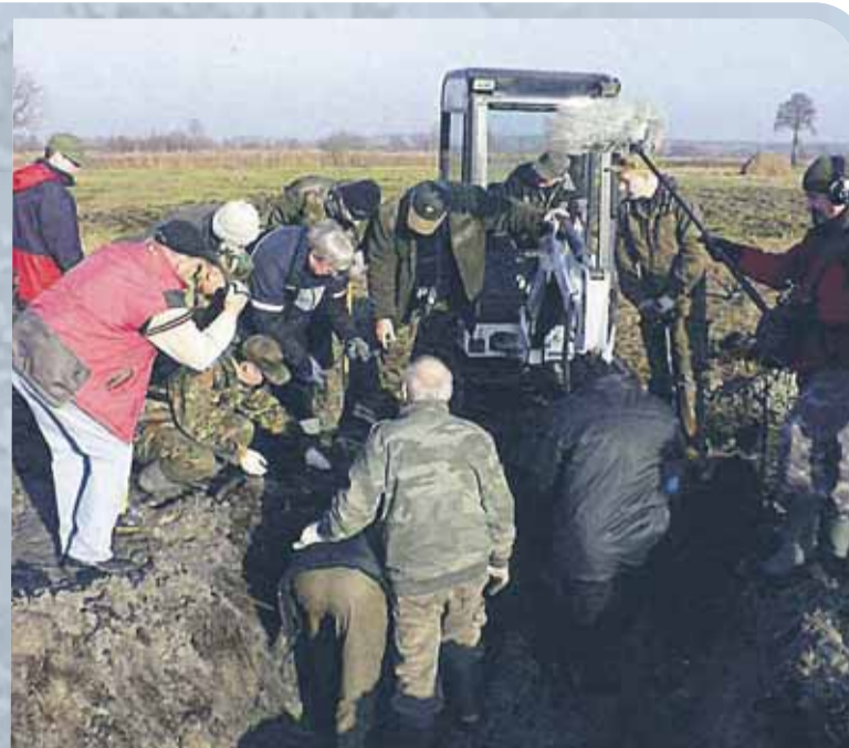
Prace eksploracyjne na terenie Wólki Radzyminskiej listopad 2011 rok

Miejsce prac poszukiwawczych odwiedziła również młodzież szkolna z Wólki Radzyminskiej pod opieką nauczycielki historii. Kolejną większą częścią, wydobytą na powierzchnię, był jeden