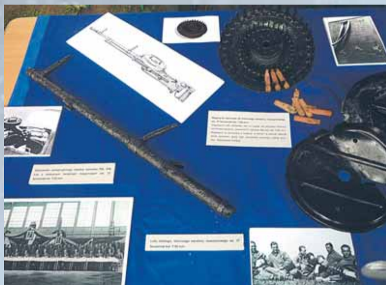
Części samolotu pokazane na pikniku historycznym w Wólce Radzyminskiej w dniu 14.09.013r.

z dziewięciu cylindrów gwiazdowego silnika PZL Bristol „Pegaz”. Dwa takie silniki stanowiły siłę nośną „Łosia”. Specjaliści podkreślili bardzo dobry stan zachowania cylindra i wiązki przewodów elektrycznych, pomimo działania dużej siły destrukcji przy zderzeniu z ziemią. Opisane elementy samolotu obok innych drobniejszych, m.in. uchwyt latarki pokładowej, części zegara pokładowego, fragmenty oszklenia kabiny z plexiglasu i inne, stanowiły rezultat pierwszego dnia prac poszukiwawczych. Prace zostały wznowione następnego dnia, w niedzielę 25 września. W poszerzonym wykopie odnaleziono jeszcze wiele drobniejszych przedmiotów z samolotu, w tym pochodzące z wyposażenia kabiny pilota, m.in. fragmenty dźwigni przepustnicy silników, elementy wyposażenia osobistego załogi, zachowane części i urządzenia elektryczne, magazynki i części karabinu maszynowego „szczeniak” wz. 37 kal. 7,92 mm. strzelca pokładowego, łuski amunicji sygnalizacyjnej i łuski z wystrzelonej amunicji pokładowej świadczące, że załoga „Łosia” broniła się przed niemieckimi myśliwcami. Ponadto wydobyto jedną ciężką przeciwwagę śmigła trójpłatowego, umożliwiającą przestawianie dwuzakresowego skoku w śmigle typu Hamilton-Standard. Również wiele aluminiowych części płatowca z widocznym biciem numerów katalogowych czę-